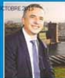
TALENT ALI SAÏB LE NOUVEAU RECTEUR D'AIX-MARSEILLE