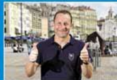
L'INTERVIEW JEAN-PIERRE PAPIN