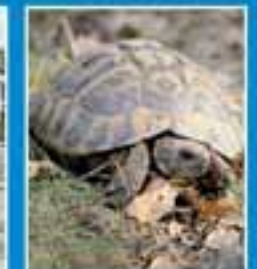
360° NATURE LES TORTUES D'HERMANN

Le mensuel de ceux qui font la Provence NOVEMBRE 2013 - N°29 3,50 €